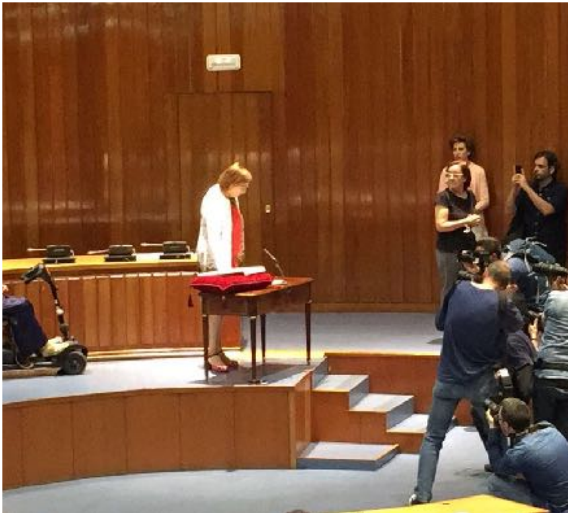
Ceaps en la toma de posesión de los nuevos cargos del ministerio