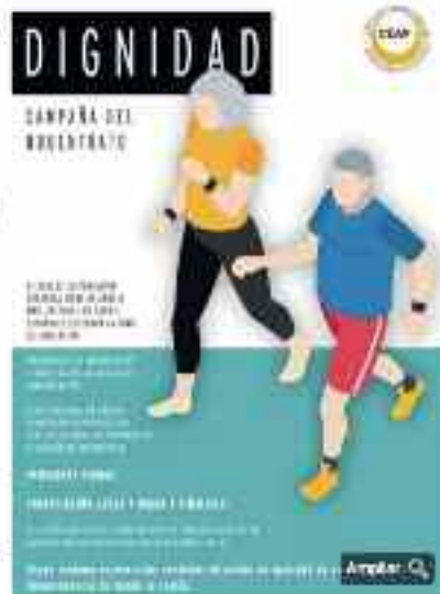
Cartel de CEAP's sobre la dignidad de las personas mayores

Propuestas con el fin de sumar apoyos de entidades y administraciones como el Gobierno