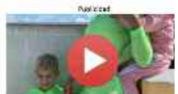
Millonaria Mamá Do...

De este modo, el Ceaps ha propuesto dedicar el 2 % del PIB a través de una financiación "justa, digna y finalista" a la atención de las personas mayores para "acomodar la justicia social".