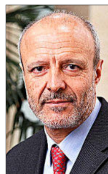
ANTONIO LLORENS FOOD SERVICE ESPAÑA

«Lo esencial ahora es trabajar para impedir que vuelva a suceder lo mismo en caso de rebrote»