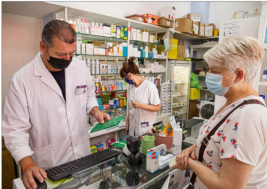
Una farmacia en Sevilla, donde hasta ahora era obligatorio el uso de mascarilla.